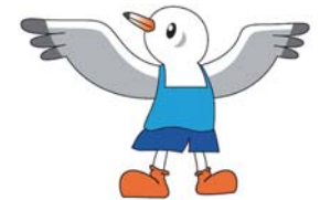
スポーツ祭東京2013 マスコットキャラクター「ゆりーと」

9月28日(土)から10月8日(火)まで第68回国民体育大会が東京都で開催されます。氷見市から22名の選手が富山県代表として出場し、活躍が期待されます。