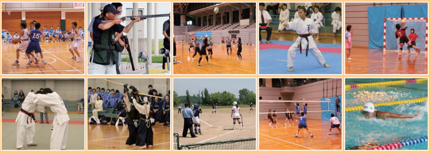
氷見市民体育大会の各競技から

5月11日(土) ふれあいスポーツセンターにて、「氷見スポーツフェスタ総合開会式」が盛大に開催されました。